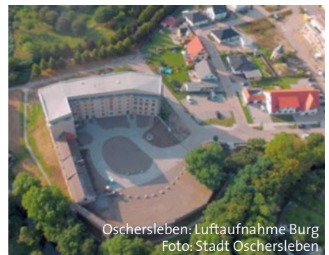
Oschersleben: Luftaufnahme Burg