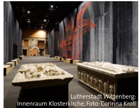
Lutherstadt Wittenberg: Innenraum Klosterkirche, Foto: Corinna Kroll