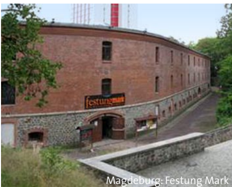
Magdeburg: Festung Mark