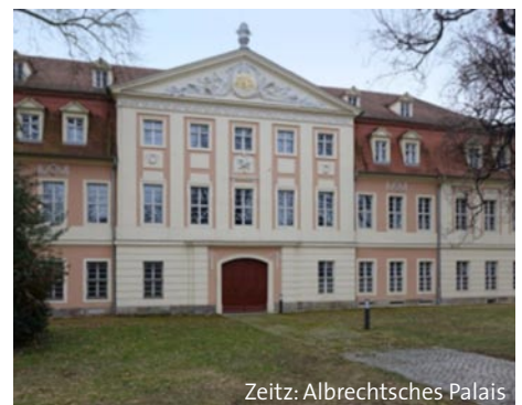
Zeitz: Albrechtsches Palais