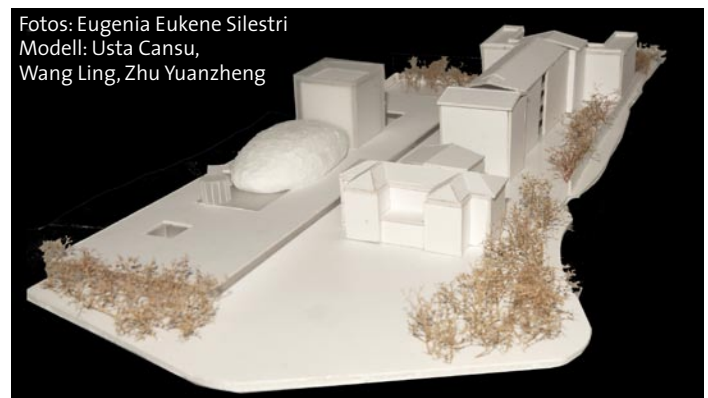
Modell: Usta Cansu, Wang Ling, Zhu Yuanzheng