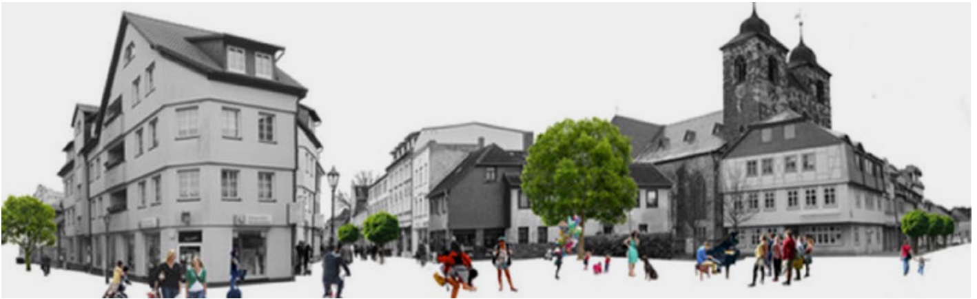
Szenario der zukünftigen Halberstädter Straße.