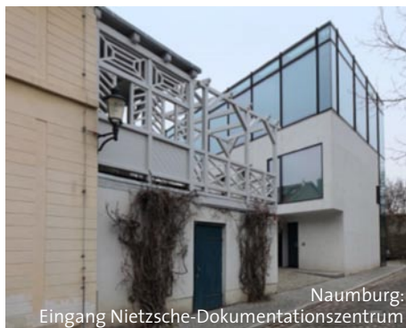
Naumburg: Eingang Nietzsche-Dokumentationszentrum