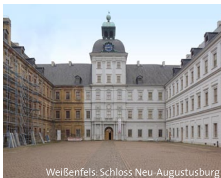
Weißenfels: Schloss Neu-Augustusburg