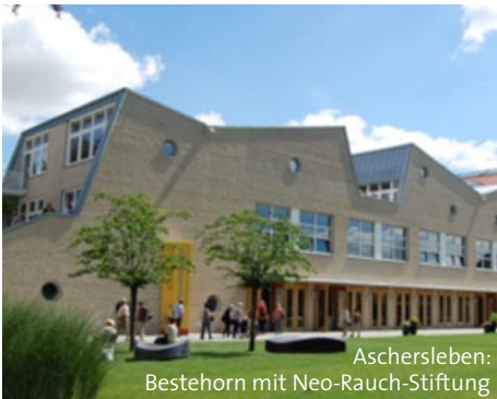
Aschersleben: Besthorn mit Neo-Rauch-Stiftung

Mit der jährlichen Vergabe einer thematisch wechselnden Auszeichnung soll eine öffentlichkeitswirksame Präsentation von guten Praxisbeispielen eines erfolgreichen Stadtumbaus im Land Sachsen-Anhalt, aber auch über die Landesgrenzen hinaus, erreicht werden.