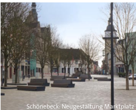
Schönebeck: Neugestaltung Markplatz