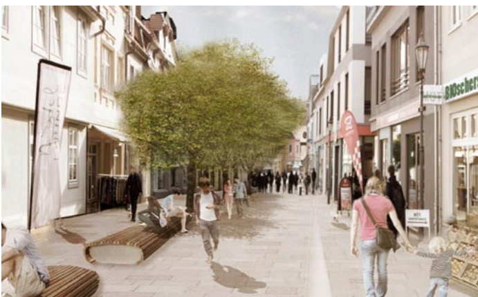
Stadtmöblierungen bieten Sitzgelegenheiten und laden zum Verweilen, Gucken und Shoppen.

Die Ergebnisse des Semesterprojekts finden Sie in einer zusammenfassenden Publikation online unter www.kompetenzzentrum-stadtumbau.de/publikationen .